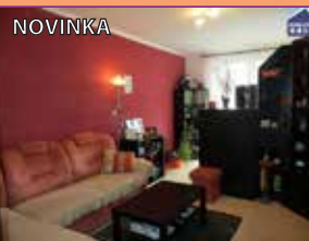
Veselí nad Moravou

Nabízíme k prodeji velmi pěkný byt 2+1, který se nachází na sídlišti Hutník ve Veselí n. Mor., o celkové výměře 64 m 2 s lodžii a nachází se ve II. NP. Byt prošel v roce 2008 rekonstrukcí (nová koupelna, podlahy, kuchyňská linka, interiérové dveře, platová okna).