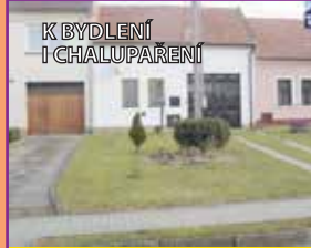
K BYDLENÍ I CHALUPAŘENÍ