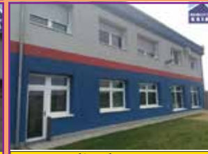
Veselí nad Moravou

Nabízíme k pronájmu v přízemí krásné, nové prostory, kancelář se zázemím a parkovištěm, které se nacházejí na okraji města Veselí n. Mor. Jedná se o velkou kancelář o výměře 68,63 m 2 , dále 2x WC muži, 2x WC ženy, chodba. Celková výměra prostor je 104 m 2 a parkoviště je o výměře 235 m 2 .