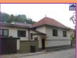
Klobouky u Brna

K prodeji novostavba nízkooenergetického rodinného domu 4+kk v obci Krumvíř. Dům je cihlový, dvoupodlažní a nachází se na pozemku cca 400 m 2 . Možnost garáže, dvojaráže nebo garážové stání. Cena včetně dokončení domu ve standardu, pozemku, přípojek, oplocení a terénních úprav. Cena: 1.890.500,- Kč Kontakt: 608 675 897 ZN.: 15H247RD