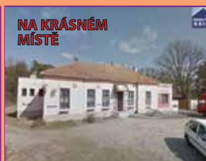
NA KRÁSNÉM MÍSTĚ