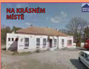
NA KRÁSNÉM MÍSTĚ